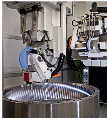
ZP I/E mit schnell wendbarem Schleifarm für die Bearbeitung großmoduliger Innen- und Außenverzahnungen