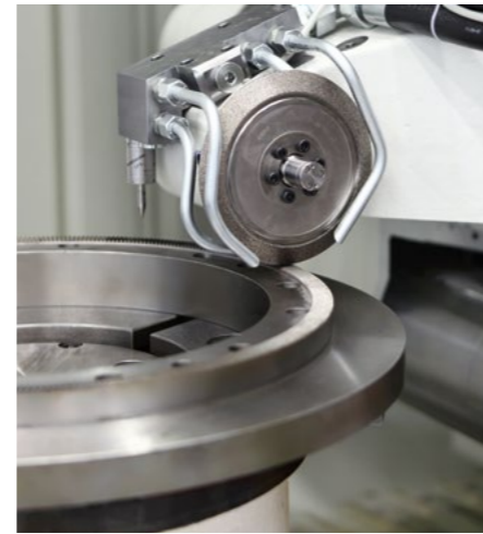
Sonderspindeln für vielfältige Bearbeitungsaufgaben