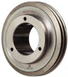
Diamant-Vollprofilrolle, mehrrillig, W-L-VPX